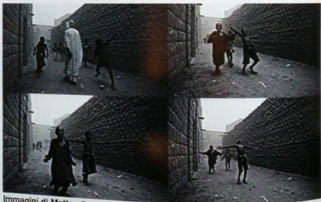
Immagini di Matteo Bottanelli